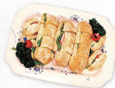
イタリアンサンド (チャパタパン)