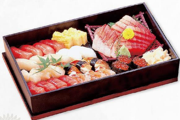
上にぎり寿司&お刺身

*価格には消費税が含まれておりません。 *お料理の器及び内容が変更になる場合がございます。