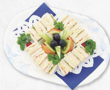
サンドウイッチ盛合せ (フルーツ入り)