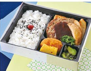
㊤-10 ハンバーグ弁当 21×16 800円