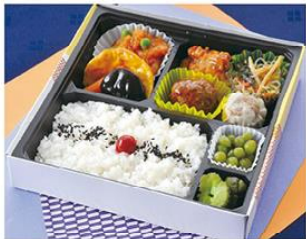
㊤-7 中華幕の内弁当 21×21 900円