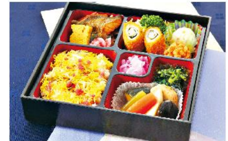
①-4 ちらし弁当 (重) 24.5×24.5 1,500 円