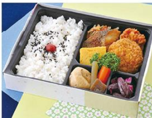
㊤-12 和風メンチカツ弁当 21×16 800円