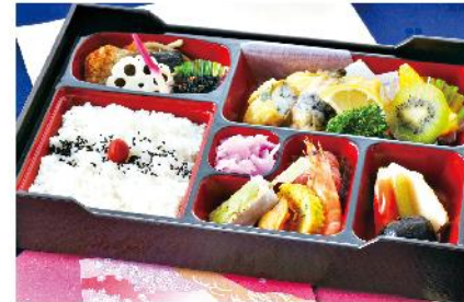
①-1 和風幕の内弁当 (重) 32×21 2,000 円