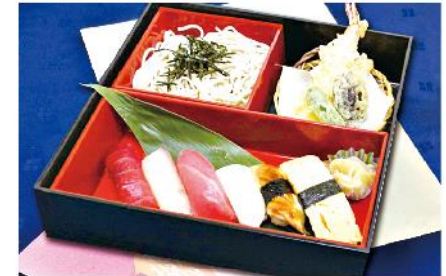
①-2 特選寿司蕎麦弁当 (重) 24.5×24.5 2,000 円