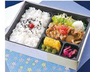
㊤-13 生姜焼弁当 21×16 700円