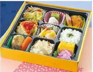
㊤-6 美園弁当 21×21 1,000円