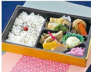
㊤-5 和風幕の内弁当 27.5×18 1,000円