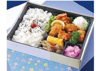
㊤-14 唐揚弁当 21×16 700円