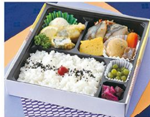
㊤-9 和風幕の内弁当 21×21 900円