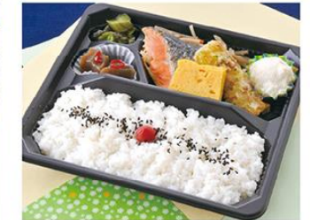
㊤-17 和風弁当 23×20 600円