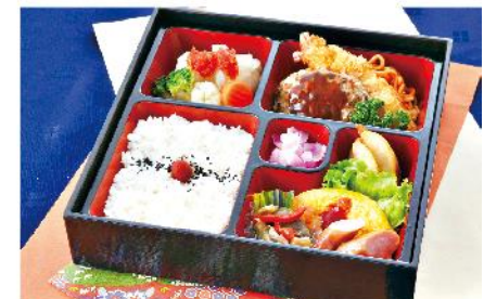
①-8 洋風幕の内弁当 (重) 24.5×24.5 1,000 円