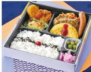
㊤-8 洋風幕の内弁当 21×21 900円