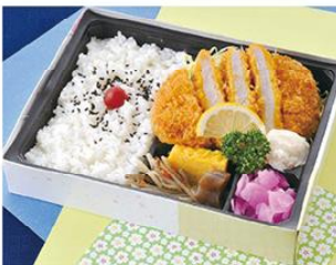
㊤-11 とんかつ弁当 21×16 800円