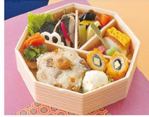
㊤-3 新能弁当 18×18 1,300円