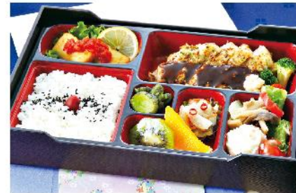
①-3 洋風グリルチキン弁当 (重) 32×21 1,500 円