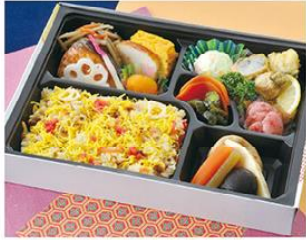
㊤-1 幕の内ちらし弁当 27×20.5 1,500円