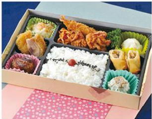
㊤-4 いろいろ幕の内弁当 27.5×18 1,000円