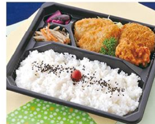
㊤-15 ミックスフライ弁当 23×20 600円