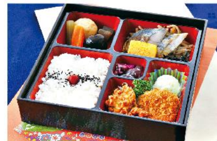
①-7 和風幕の内弁当 (重) 24.5×24.5 1,000 円