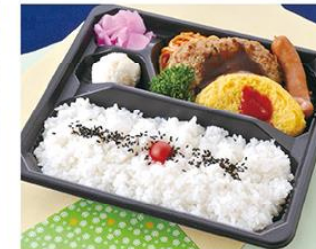
㊤-16 洋風弁当 23×20 600円