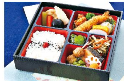
①-5 和風幕の内弁当 (重) 24.5×24.5 1,300 円