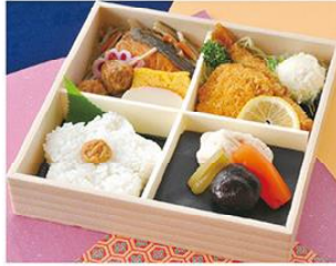
㊤-2 松花堂折 21×21 1,500円