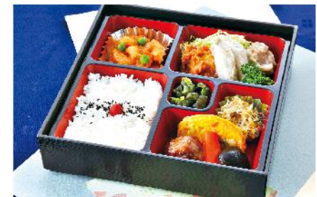
①-6 中華幕の内弁当 (重) 24.5×24.5 1,300 円